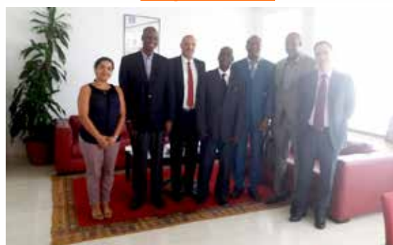
Le Groupe Technique de Suivi du Burundi